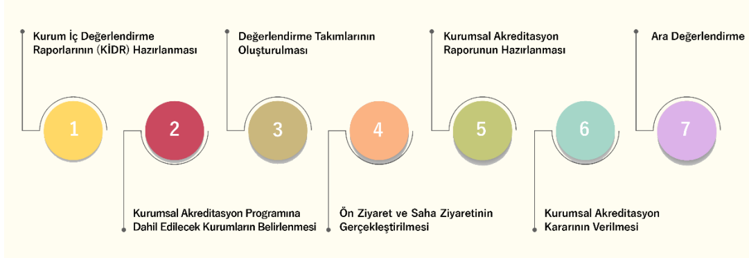
Şekil 3 akreditasyon programı değerlendirme sürecinin haritası

Her yıl KAP’a dâhil edilecek yükseköğretim kurumları YÖKAK tarafından belirlenmekte ve belirlenen bu yükseköğretim kurumlarının yapısına uygun olarak değerlendirme takımları oluşturulmaktadır. Söz konusu değerlendirme takımları tarafından ilgili yükseköğretim kurumlarına iki ziyaret ( ön ziyaret ve saha ziyareti ) gerçekleştirilmektedir. Değerlendirme takımları, başta üst yönetim olmak üzere akademik ve idari yöneticiler, akademik ve idari personel ve öğrencilerin de içinde buldukları geniş bir ağda görüşmeler gerçekleştirmektedir. Bu ziyaretlerin neticesinde değerlendirme takımları tarafından Kurumsal Akreditasyon Raporları (KAR) hazırlanmakta ve bu raporlar göz önünde bulundurularak YÖKAK tarafından akreditasyona ilişkin karar verilmektedir. Şekil 3 akreditasyon programı değerlendirme sürecinin haritasını göstermektedir.